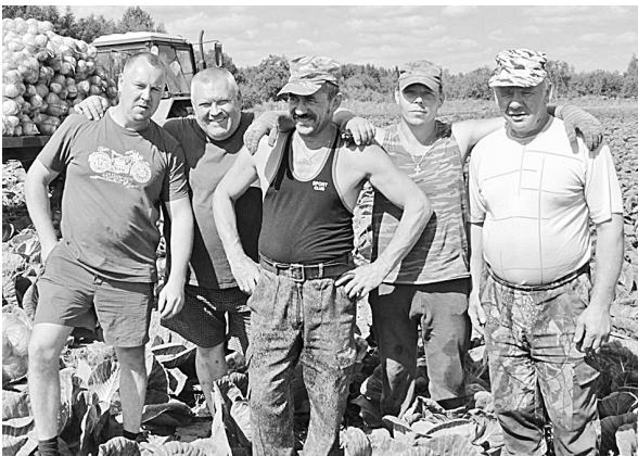
Уборка капусты в районе деревни Бор