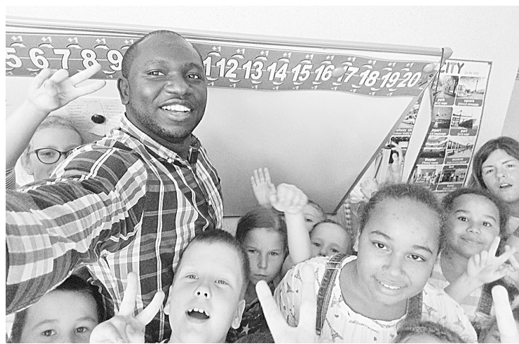
Когда учёба в радость

Адреса филиалов детского центра «HELLO»: ул. 9 Января, 44; ул. Сушанская, 6в; ул. Ленинградская, 97. Телефон для справок: 8-921-204-93-56. ©