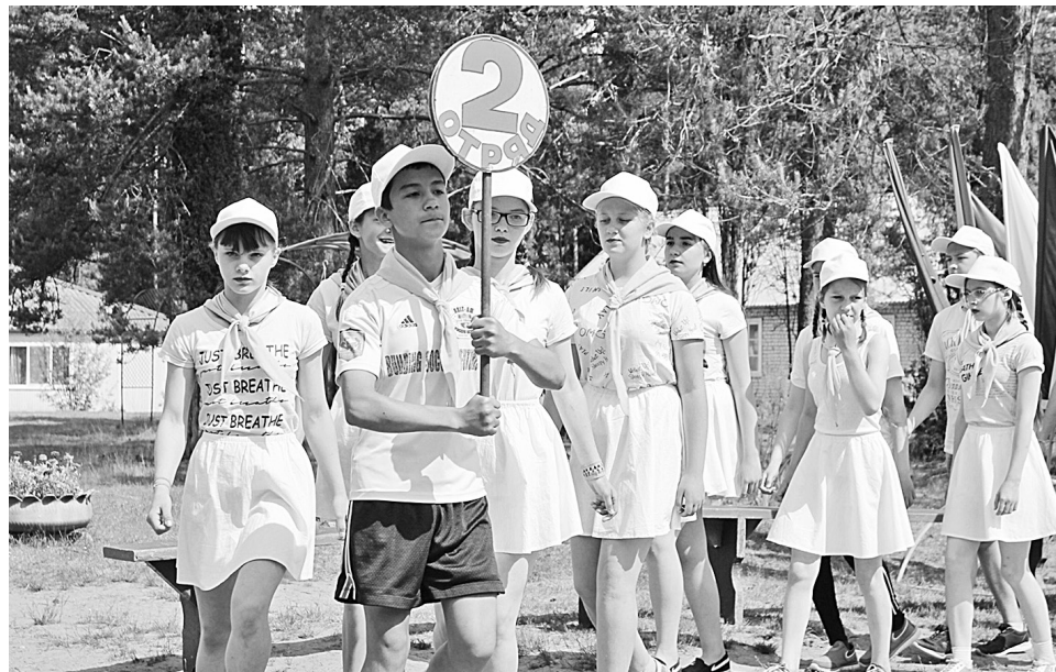
Построение отрядов в родительский день

При проведении согласования местоположения границ при себе необходимо иметь документ, удостоверяющий личность, а также документы о правах на земельный участок (часть 12 статьи 39, часть 2 статьи 40 Федерального закона от 24 июля 2007 г. № 221-ФЗ «О кадастровой деятельности»).